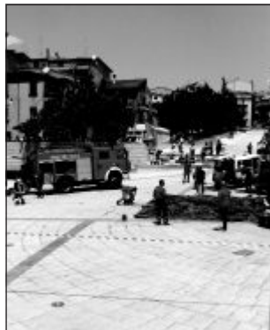
La simulazione della Croce rossa

In particolare, è stato inscenato un sinistro nel quale era coinvolto un pullman con venti persone a bordo. Nell'occasione è stata montata, in pochi minuti, una tenda pneumatica, che serve a dar corso ai primi interventi sul posto per i feriti più lievi, in modo da non intasare l'ospedale più vicino, dando quindi priorità al codice rosso. Un simile intervento va chiaramente