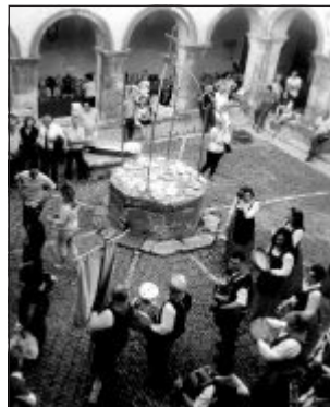
La festa nel centro storico

Tra gli eventi ricordiamo: la Tavola rotonda dal tema "Educazione alimentare, percorsi partecipati nella Valle del Crati e dell'Esaro" a cura del Gal Valle Crati; la Deco (Denominazione di origine comunale), strumento per la valorizzazione delle produzioni locali - il Pane e i Taralli di Altomonte; i laboratori e degustazioni su Pane, olio e vino; la Tavola rotonda "I Grani antichi, oro del mediterraneo - focus sulla valorizzazione delle risor-