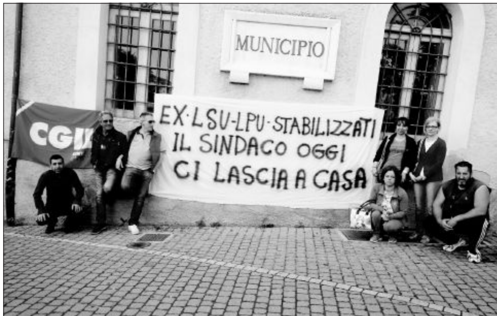
Il sit-in davanti alla sede comunale

Tuttavia, il rapporto di lavoro, insieme al servizio alla Acritransport, ebbe fine lo scorso anno e fin da subito si pose il loro problema, diverso rispetto ai colleghi che negli anni erano stati assunti nell'azienda e non provenienti dal bacino Lsu-Lpu. Dopo la fine del rapporto di lavoro, il Comune decise - in ordine al trasporto scolastico - prima per un affidamento diretto del servizio, quindi per un cottimo fiduciario. Nelle pieghe di queste dinamiche, però, la condizione di questi lavoratori è sempre rimasta in una sorta di limbo che presentava ben poche possibilità di sbocco positivo. Ieri, in tarda mattinata, il gruppetto di lavoratori, accom-